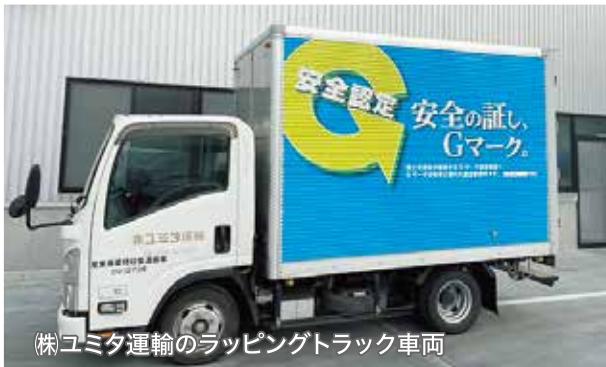
(株)ユミタ運輸のラッピングトラック車両

利用者がより安全性の高い事業者を選びやすくするとともに、事業者全体の安全性向上に対する意識の高揚と事業者の安全性を正当に評価し、認定公表する「安全性優良事業所」認定制度（Gマーク認定制度）の更なる認知度アップを図るため、当協会では安全性優良事業所のシンボルマークである「Gマーク」のデザインを施したラッピングトラックの走行による広報活動に努めている。