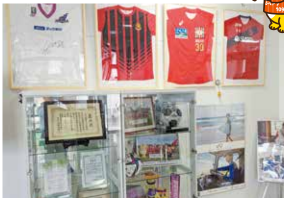
県ト協事務所エントランス サイン入りユニフォームやボールを展示

前年の「トラックの日」キャンペーン事業では、福島ユナイテッドFCでの冠試合を行い、サポーターと共に大いに盛り上がりました。今年も各プロスポーツチームとのコラボや応援を通してトラック運送業界の認知度向上及び業界イメージアップに向け、各チームと連携し福島を盛り上げていきます!