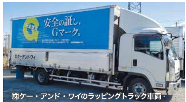
(株)ケー・アンド・ワイのラッピングトラック車両

現在、福島県内では會津通運(株)、(株)帝北ロジスティックス、岡田陸運(株)、丸カ運送(株)、郡山運送(株)、ダイトーロジスティックス(株)、磐城通運(株)、(株)丸や運送、(株)須賀川東部運送の9両が会津地区・県北地区・いわき地区・相双地区・県中地区・県南地区を中心にPR走行しており、「Gマーク」の啓発活動に貢献している。