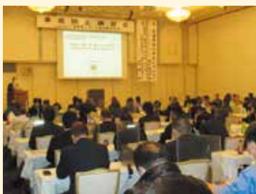
講演会終了後は、4年ぶりとなる懇親会も開催された。