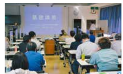
【熱心に受講する参加者】

当講習会は新型コロナウイルス感染予防の為、テーブルの間にアクリル板仕切りを取り付け、受講者席の間隔を空けるなどの感染予防対策を講じ開催している。