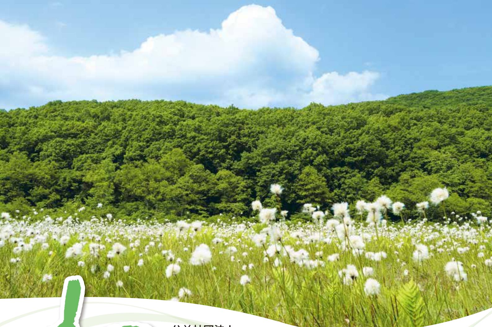
写真／宮床湿原 (南会津郡南会津町)