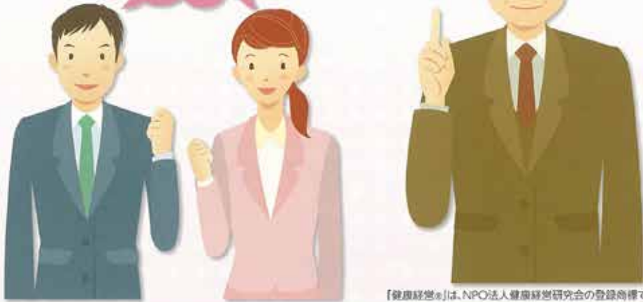
【健康経営®】は、NPO法人健康経営研究会の登録商標です。