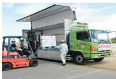
【緊急物資輸送訓練(支援物資をトラックに積み込む)】