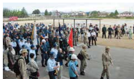
【本部長(内堀知事)による訓練開始式の様子】