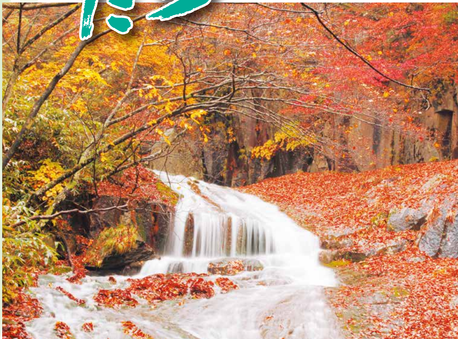
▲奥岳・あだたら溪谷自然遊歩道(二本松市)