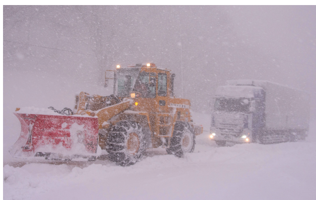
令和4年2月 国道13号 福島市 スタック車両のけん引