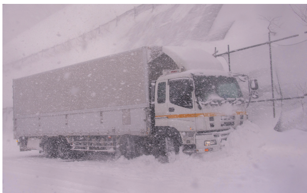
令和4年2月 国道13号 福島市 雪壁への衝突事故