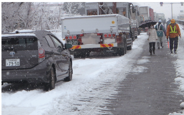
平成26年2月 国道4号 福島市 スタック発生による車両滞留