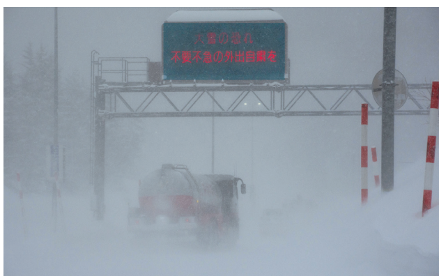
令和4年2月 国道13号 福島市 ホワイトアウト発生状況