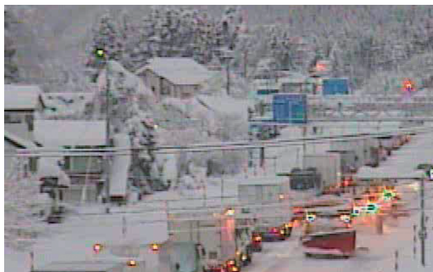
令和4年12月 国道49号 会津坂下町 スタック発生による車両滞留