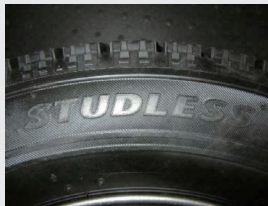
スタッドレス表記の例