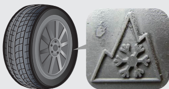
(タイヤの側面に表示されています)