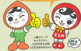
人権イメージ キャラクター 人KENまもる君 人KENあひまちゃん