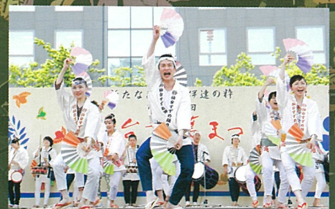
仙台すずめ踊り「伊達の舞」