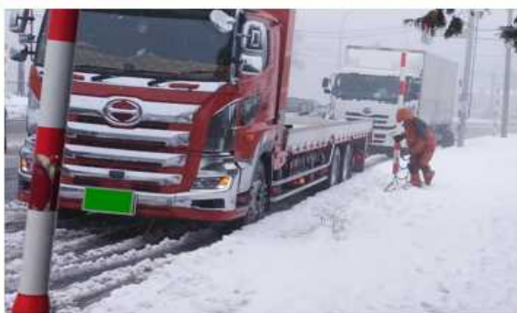
▲大型車が車道上でチェーンをかけ始め、後続の車両が連なり渋滞や立ち往生の原因に(R3.11.24の様子)

降雪時には、立ち往生する前に早めのチェーン装着を心がけましょう。立ち往生した後の装着は極めて困難です。 なお、 チェーンの着脱作業は、車道ではなく駐車帯など通行の妨げにならない場所で行ってください。 車道上でのタイヤチェーンの装着等は、 事故などの危険を伴うだけでなく、除雪作業の支障となったり、後続車が立ち往生する原因 となったりするなど、他のドライバーへの迷惑となる場合もあります。